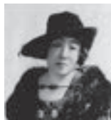
三浦 環 (みうら たまき)

静岡国際オペラコンクールは、静岡県ゆかりのプリマドンナ三浦環をたたえ、没後50年にあたる1996年から3年ごとに浜松で開催されています。世界から集まった351名の応募者の中から、予備審査を通過した優秀なオペラ歌手たちが得意なオペラアリア(オペラの中で登場人物が歌う独唱曲)を歌うほか、オペラの一役を演じその歌唱力と表現力を競い合います。